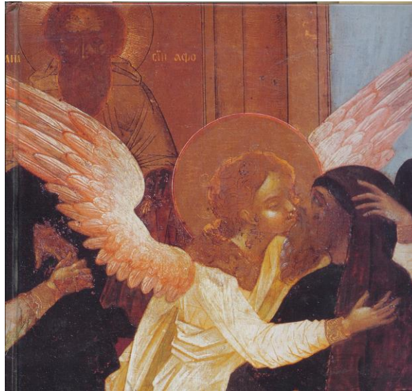
Pravednaja zsizny monahov. [Szerzetesek igaz élete]. 19. század első fele (részlet)

Filocaliában az “izangeliá”-ra – az angyallal azonossá válásra – törekvő keleti szerzetesség alapbeállítottságát, mely azt a követelményt is magában foglalja, hogy ezt a “harmadik szemet” pillanatra sem szabad behunyni, szem elől veszítve az igazi, a mennyei realitást: „Amely lélek örködni igyekszik (...), annak kerubszeme van, hogy azt örökké az ég látványára függessze, és azt fürkéssze.” 13