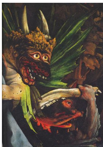
Matthias Grünewald: Isenheimi oltárkép 1512-1516 (részlet)

A bukott angyal, Lucifer vagy Sátán legmeghatározóbb tulajdonsága – vaksága (a caecitas ). A bukott angyal – vak angyal. Alábukása a földre, kihullása a mennyei hierarchiából, méghozzá annak is a csúcsáról, az Isten Arcát legközelebből látó szeráfok karából – megvakulását jelenti. Engedetlensége, szembefordulása Istennel nem más, mint vakká válás Istenre.