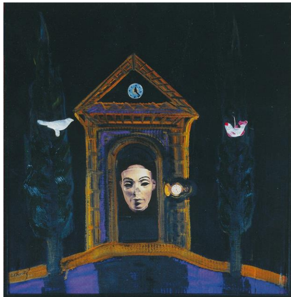
El Kazovszkij: Aranytemplom (1990)