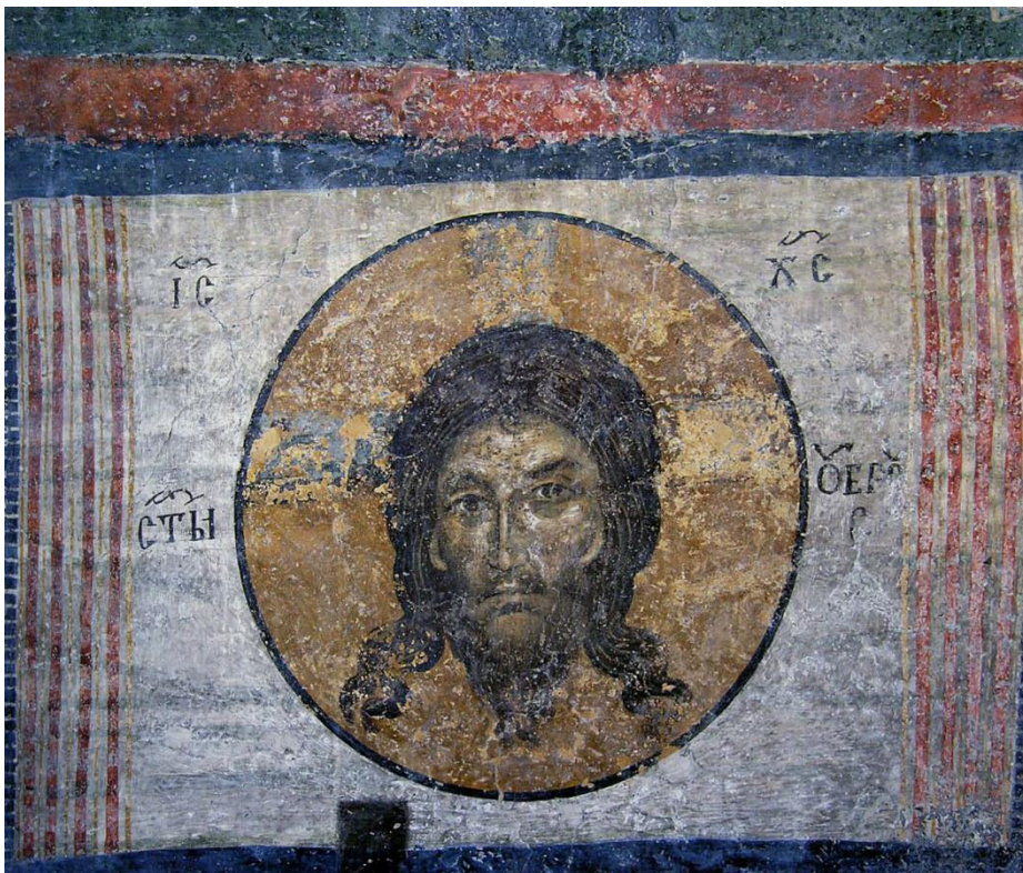
Mandülion vagy Szent Kendőkép ( Szvjatoj Ubrusz ), Nem Kéz Alkotta Kép ( Akheiropoiéton ) a X. században épült Szófia melletti Bojana Templom kupola alatti boltívén.

egyszerre volt Jézus érintésreklyéje és ikonja – a „megrendelő” Abgár király parancsára Edessza városkapuja fölé helyezték ki egy falfülkében, de a város későbbi ostroma során, nehogy elpusztuljon, a fülkét befalazták, egy örökmécessel együtt, amely az ikon előtt lobogott. Mikor évtizedekkel később a kép fülkéjét kibontották, kiderült, hogy újabb képcsoda történt: a Krisztus-kép – a fényforrásul szolgáló mécses közreműködésével – leképeződött a fali kerámia egyik csempéjén.