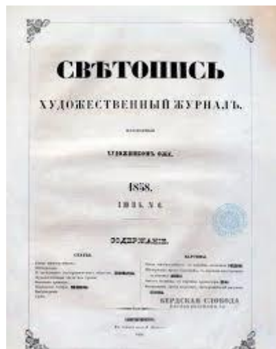
Az első oroszországi fotográfiai periodika 1858-ból.

Van – és ezzel fejezem be e kissé hosszúra nyúlt megnyitót – a vallási kultusznak és a modern technikának, ikonnak, fotogramnak és fotográfiának egy még bizarabb, de annál sokatmondóbb találkozása, amelyre a Szent Hegy – Athosz – Pantelejmon kolostorában került sor az 1900-as évek elején. Ebben a találkozásban bizonyára szerepet játszott, hogy az isteni fény (a teremtetlen fény) alkotta, „fényre festett” ikont az ortodox képteológiában fényírásnak (fotogramnak!) – szvetopisz , szvetopiszanyije – nevezik, ugyanúgy tehát, ahogy a görög fotográfia szót fordították oroszra a 19. század közepén (az 1850-es években megjelenő első orosz fotográfiai szakfolyóirat címe is ez volt: Szvetopisz ).