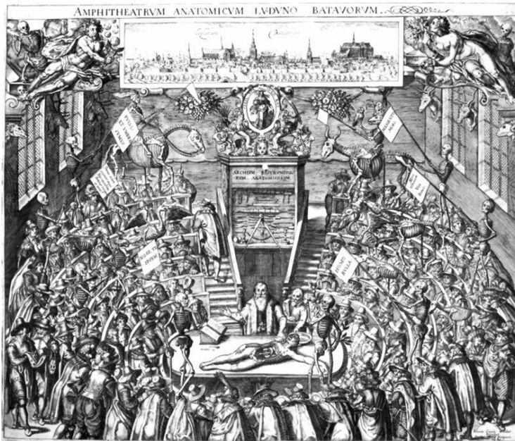
Az első anatómiai teátrum, amely 1594-ben nyílt meg a padovai egyetemen

kegyes vallási, ismeretszerző célú tudományos és tisztán esztétikai látványosságként fogta fel az előadásokat.