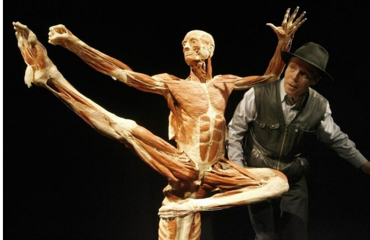
Gunther von Hagens, egyik alkotásával a «Body Worlds» vándorkiállításon a kora újkori sebészdoktorok fekete kalapjában