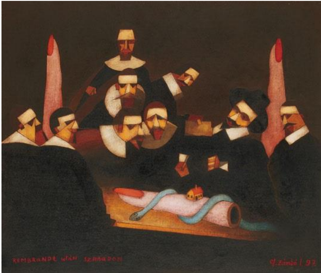
ef. Zámbo István: Tulp doktor anatómiája (1997)