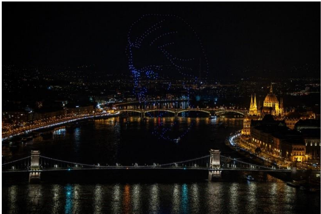
Petőfi Sándor drón-portréja a Lánchíd felett

ahogy költő tűnik el – közpénzként ha égre kel mint drónok ha rajzanak tűnik el e rajzalak.